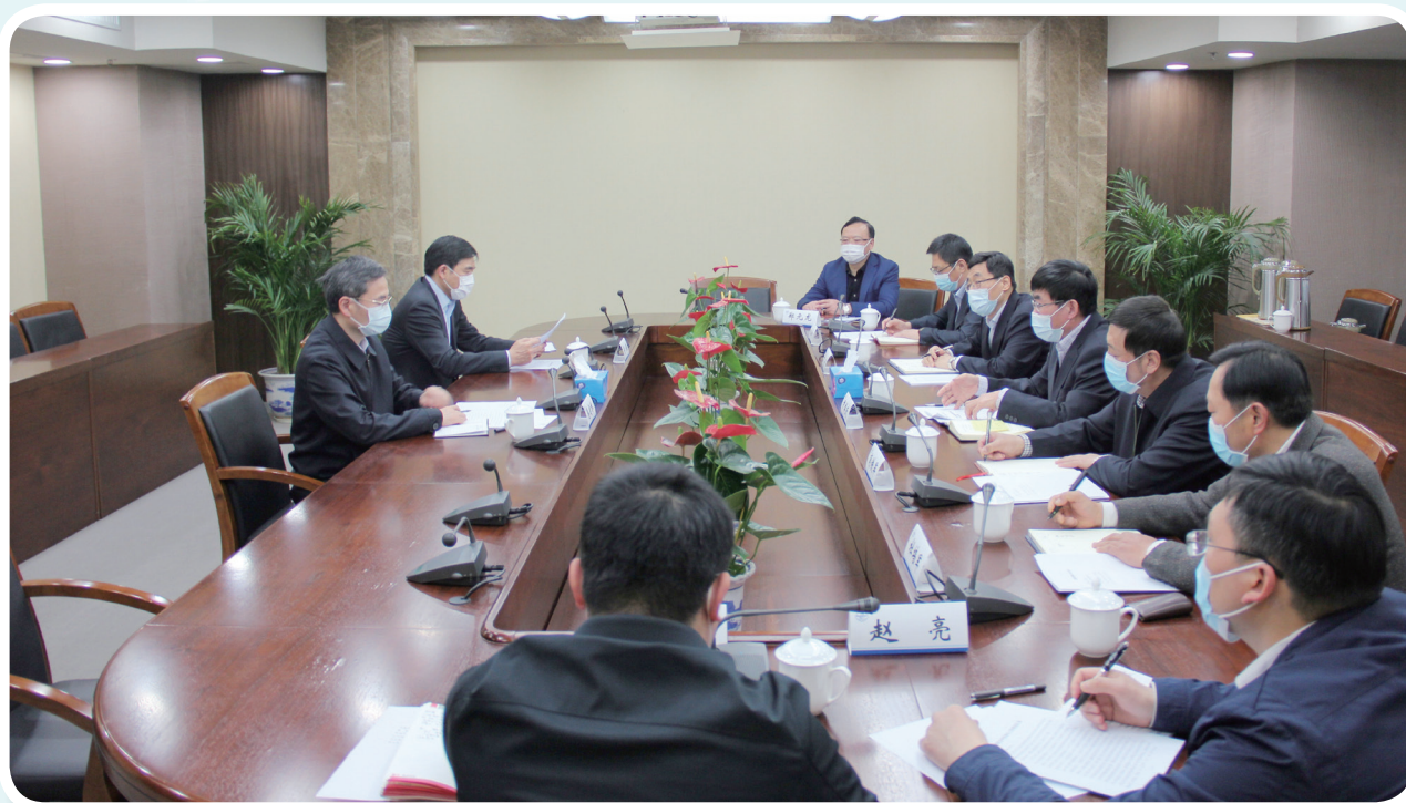
4月15日，江苏省政府惠建林副省长、黄澜副秘书长一行到省贸促会调研，听取省贸促会工作汇报，与领导班子成员座谈。