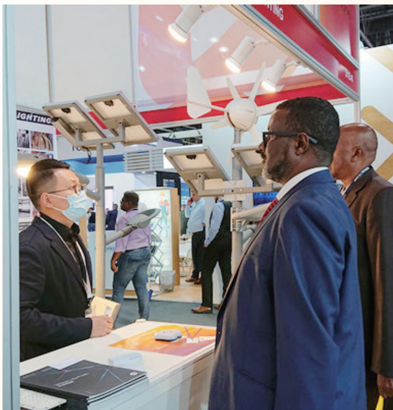
▲组织企业在线参加 APEC 中小企业跨境电商峰会