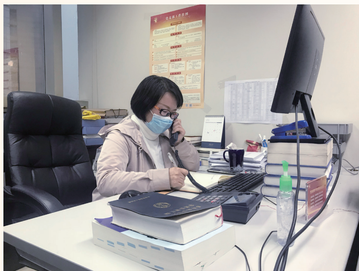
▲贴心提供商事法律咨询服务

我会党组深入贯彻落实“五抓五促”提效能、全力夺取“双胜利”专项行动，充分发挥贸促会海外“朋友圈”资源优势，全力帮企业解难事渡难关。