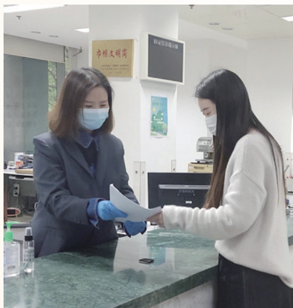
▲帮助企业办理加急原产地证

联系 40 余家境外机构，寻求防疫物资供货信息，同步建立防疫物资进口企业群，协调各方资源采购 5000 只医用口罩驰援武汉市贸促会，促成巴拿马中华总商会向江苏捐赠口罩 8280 只。联络省内生产经营防疫物资的 56 家企业与 75 个境外国家机构对接，提供精准配套服务。为企业提供 24 小时“足不出户”办证服务，帮助 46 家企业开通自主打印服务功能，为 454 家注册企业免费邮寄 1000 份原产地证书。全面开展 ATA 单证册、商事证明书及代办领事认证等在线受理，实现贸促服务“不断档”，共出具 ATA 单证册 30 份、国际商事证明书 3156 份、代办领事认证 2773 份。针对霍尼韦尔传感器联某工厂复工审批困难，及时与地方政府沟通协调，帮助在 24 小时内按规定有序复工，加紧生产抗疫急需医疗物资。