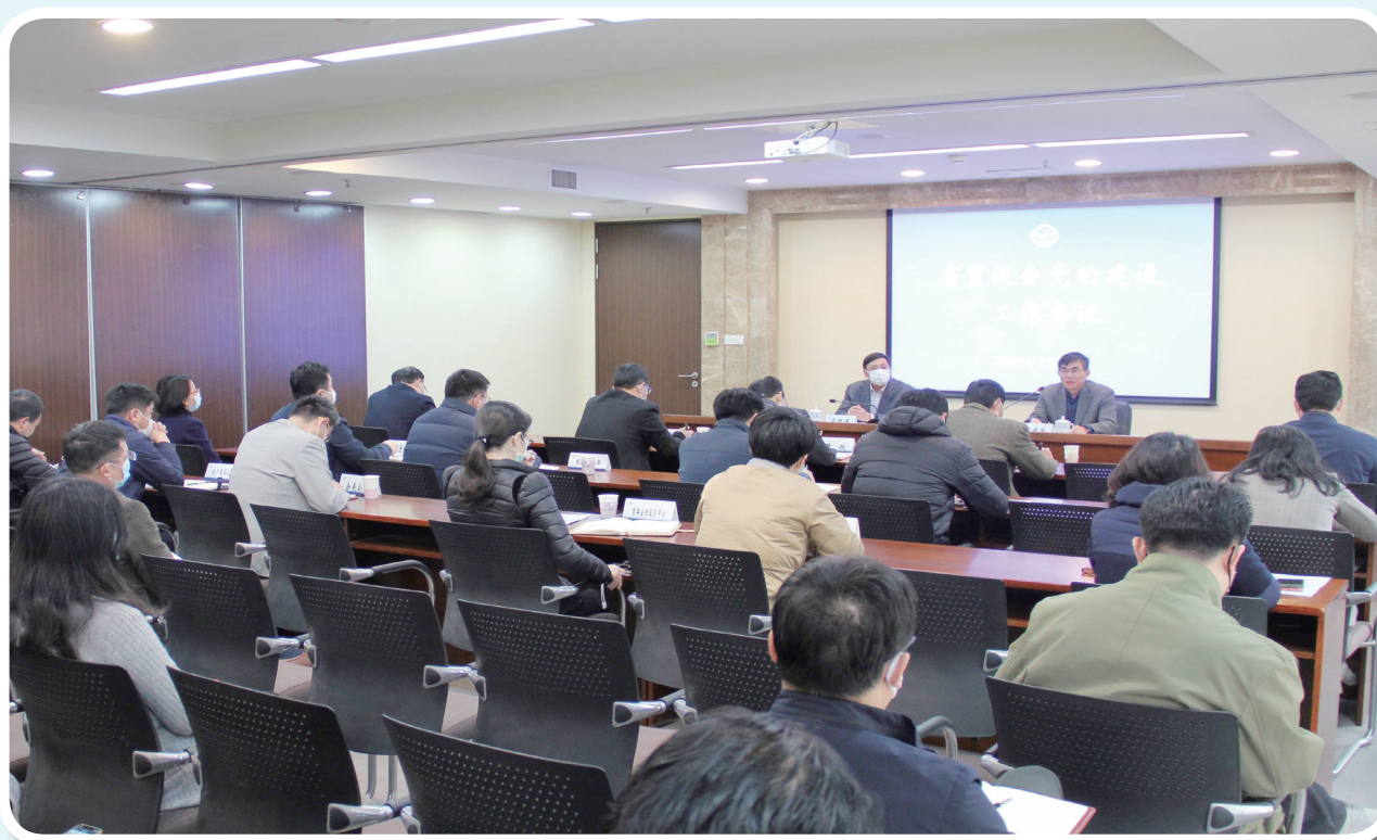
3月27日，我会召开2020年度党的建设工作会议，会党组成员、机关党委委员、机关纪委委员、各支部委员、部（室）单位主要负责同志参加了会议。