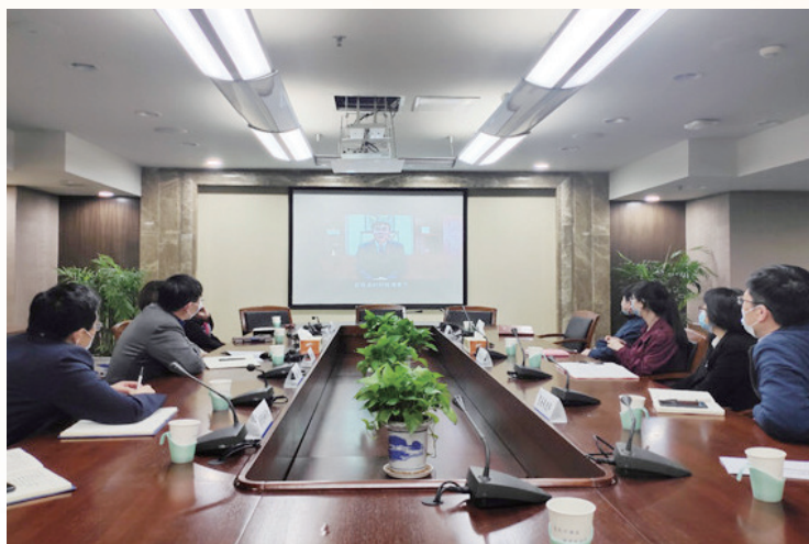
▲组织省内企业参加 2020 年中东国际电力、照明及新能源展